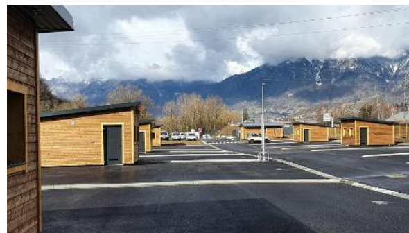
Aire des gens du voyage Albertville

• Limiter les terrassements au maximum tant pour les voies de circulation que pour les emplacements ; les bâtiments peuvent facilement s'inscrire dans la pente si nécessaire.