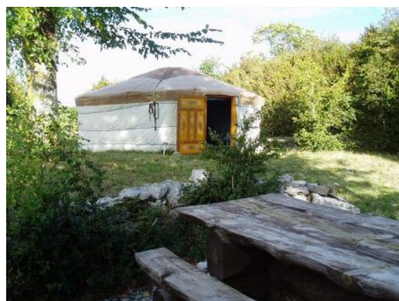
Yourte chez l'habitant