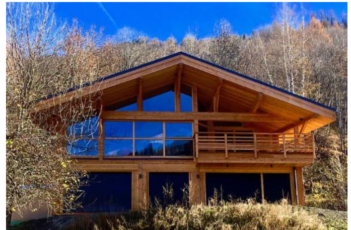
Chalet ossature bois Sainte Foy

L'arrière des constructions est souvent l'espace le moins soigné des cabanes, où l'on retrouve des annexes en matériaux de récupération divers, des gravats, du stockage de bois, des bacs de récupération d'eau etc