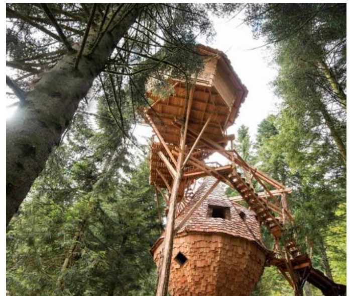
La Bresse Clairière aux cabanes