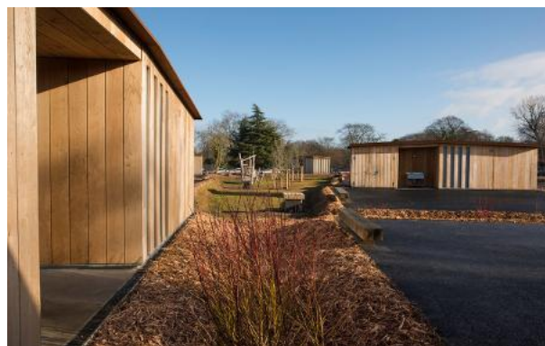
Aire des gens du voyage Paris